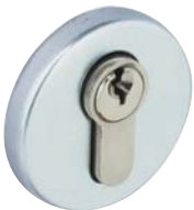
Outil de codage face avant